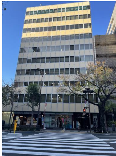
《第2星光ビルの外観/ Dai-2 Seiko Bldg.》

8th Floor Dai-2 Seiko Bldg. 4-2-11 Kudankita, Chiyoda-ku, Tokyo, 102-0073