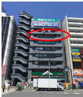
《DS市ヶ谷ビルの外観》