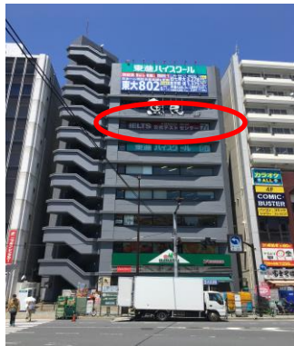
《DS市ヶ谷ビルの外観》

〒162-0844 東京都新宿区市谷八幡町2-1 DS市ヶ谷ビル 7F TEL：03-6280-7066